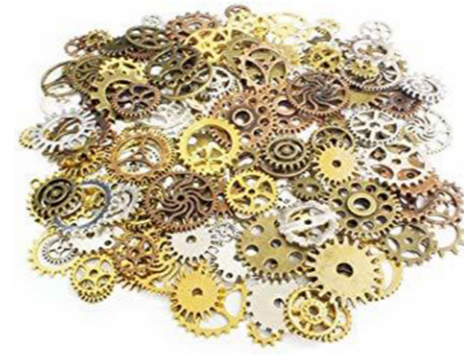
細かい装飾等は弊社倉庫にて 歯車など貼り付けて完成